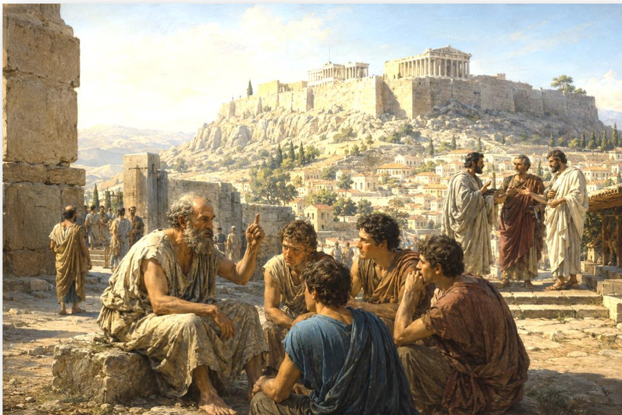
ILLUSTRATION N°1 : LE PHILOSOPHE SOCRATE ET SES ELEVES A ATHENES

Enfin, les questions que chacun se pose individuellement ne sont pas seulement privées. Elles rejoignent souvent de grands problèmes de civilisation : le rapport à la technique, à l'éducation, à la vérité, au désir, à la justice ou au vivre-ensemble. Le dialogue philosophique sert alors à rendre ces problèmes visibles et à essayer de les comprendre ensemble.