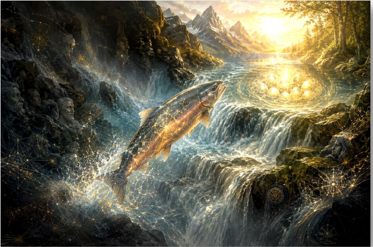
ILLUSTRATION N°8 : LE SAUMON REMONTANT LE COURANT POUR FRAYER