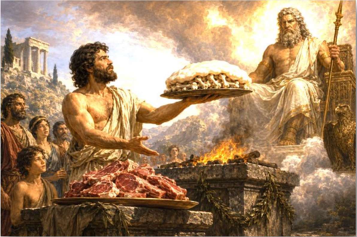
ILLUSTRATION N°4 : LA RUSE DE PROMETHEE