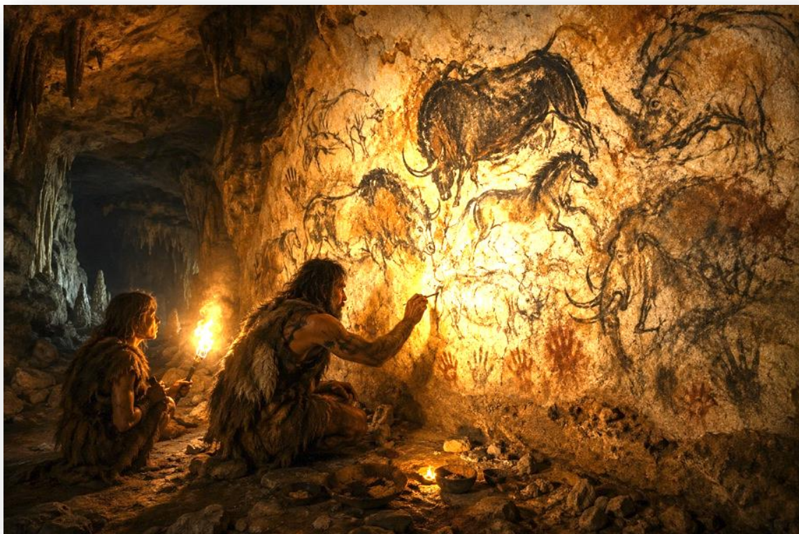
ILLUSTRATION N°10 : LES PEINTURES DE LA GROTTTE CHAUVET

Cette distinction est essentielle pour penser nos techniques contemporaines. Un smartphone, un réseau social, une intelligence artificielle ou un médicament ne sont pas simplement bons ou mauvais. Ce sont des pharmaka. Ils peuvent contribuer à notre individuation, à notre savoir, à notre mémoire et à nos relations ; mais ils peuvent aussi produire de la dépendance, de la désindividuation, de la surveillance ou de la destruction de l'attention.