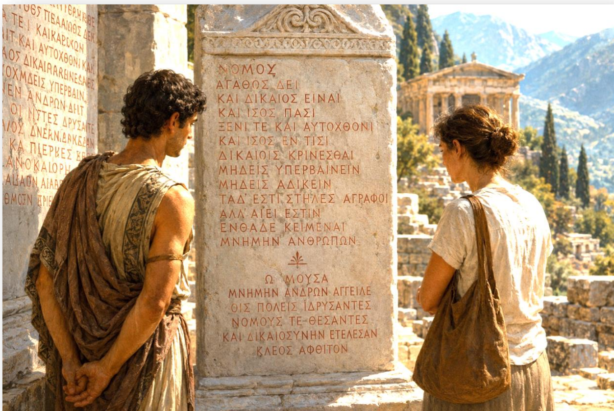
ILLUSTRATION N°2 : LECTURE SUR L'INSCRIPTION ANTIQUE

L'écriture est un « opérateur de publicité » : on grave les lois et les poèmes dans le marbre — parfois peints en rouge pour être immanquables, comme à Delphes — afin que nul ne les ignore. Un citoyen d'aujourd'hui peut lire ces inscriptions avec la même proximité que celui de l'époque : l'écriture abolit la distance du temps.