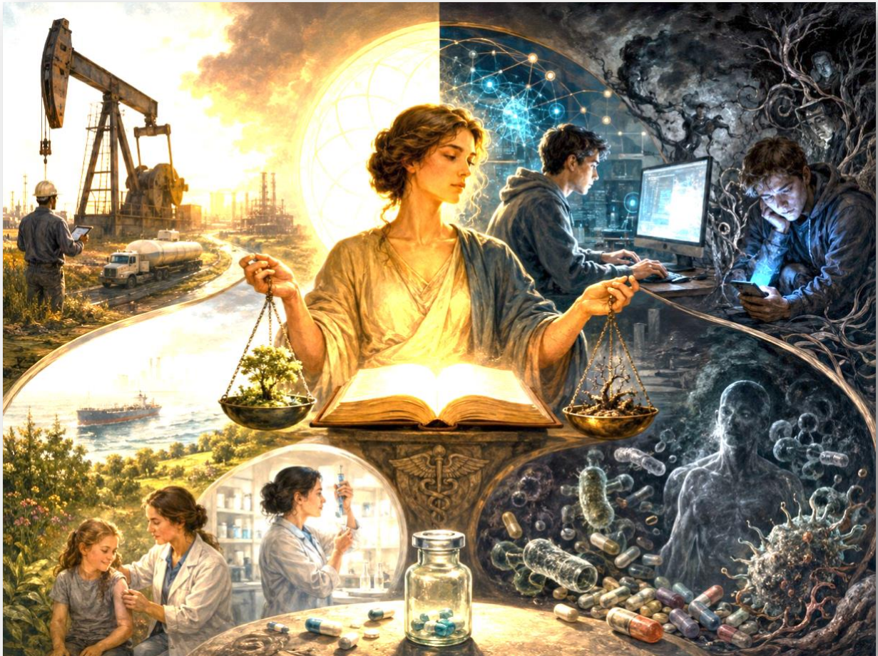
ILLUSTRATION N°3 : L'EQUILIBRE DES CHOIX HUMAINS ET MODERNES

réserve, de confiance ou de médiation. La question n'est donc pas seulement : faut-il tout rendre public ? Elle est plutôt : comment organiser techniquement, juridiquement et politiquement la publicité des informations pour qu'elle serve la vérité et la démocratie sans détruire les conditions de la vie commune ?