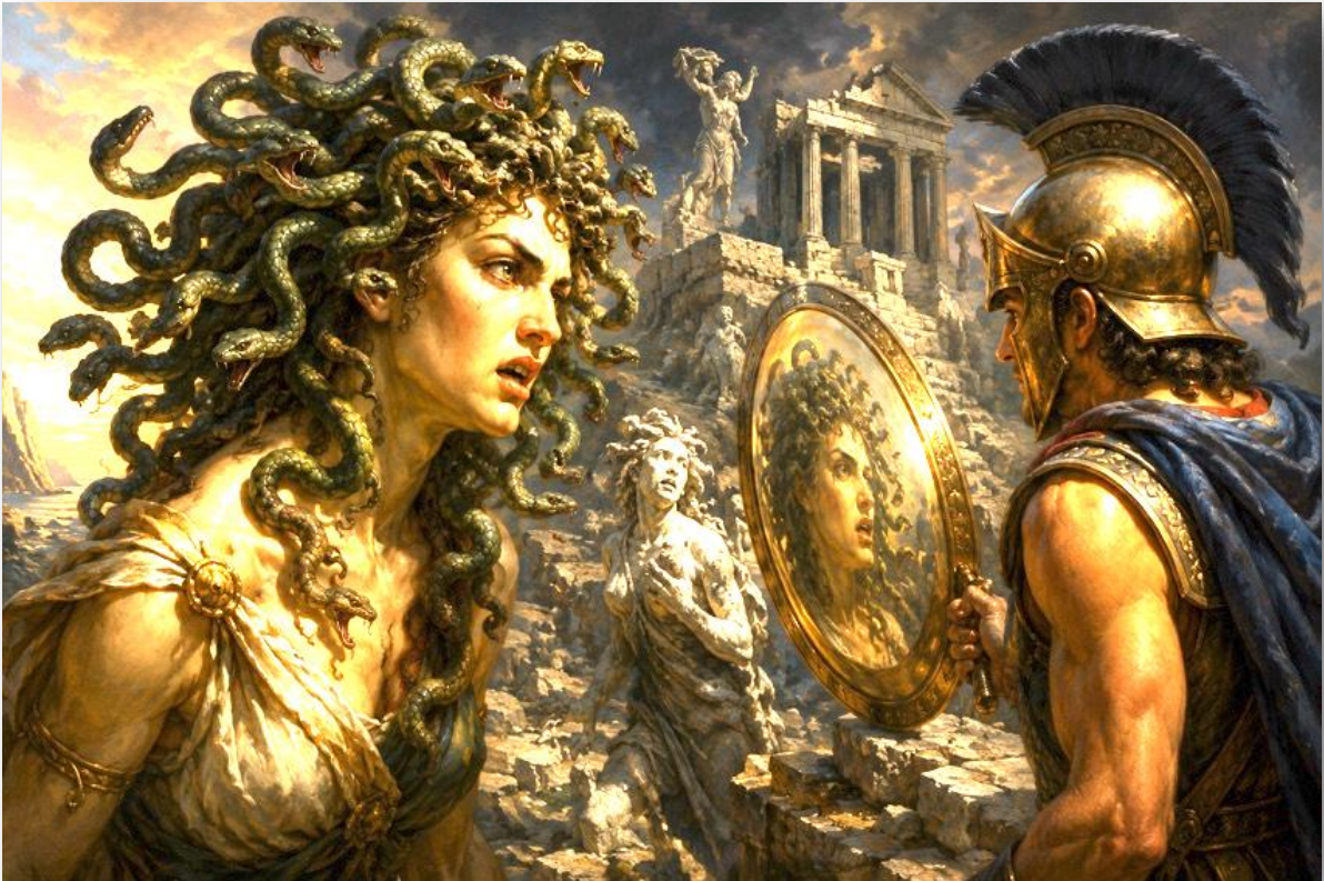
ILLUSTRATION N°5 : LA MEDUSE ET LE MIROIR