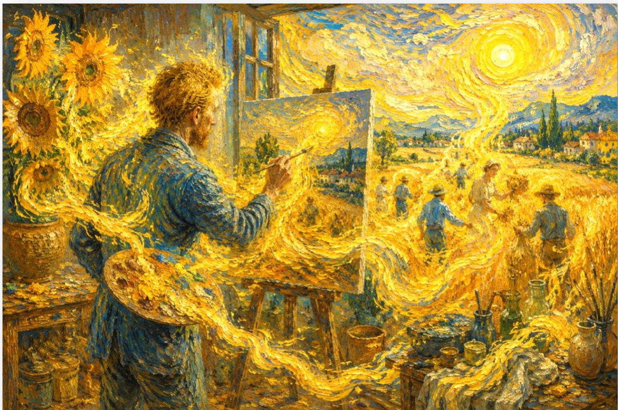
ILLUSTRATION N°6 : LA NOTE JAUNE DE VAN GOGH

Le comportement grégaire, symbolisé par le troupeau de moutons, mène à la désocialisation et à la barbarie. Cette régression conduit à l'exclusion de l'autre et, à l'extrême, au totalitarisme. Freud explique, dans Psychologie des foules et analyse du moi , comment les individus s'identifient de manière régressive à un chef — comme dans le nazisme de 1933. Même les foules acclamant un dirigeant adulé doivent être regardées avec vigilance, car une foule peut toujours céder à la panique.